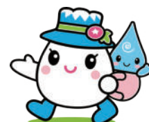
白山手取川ジオパークイメージキャラクター ゆきママとしずくちゃん

【申込締切】 2024年11月17日（日） 正午まで ※定員に達し次第受付を締切ります。