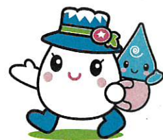
白山手取川ジオパークイメージキャラクター ゆきママとしずくちゃん