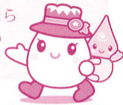
白山手取川ジオパークイメーজキャラクター ゆきママとしずくちゃん

白山のふもとは世界的にも屈指の豪雪地帯なんだ。雪が多いから『雪だるままつり』ができるんだね。大量のお雪もいっぱいのお雪だるまも、この地域ならではの、地球活動の一部なんだよ。